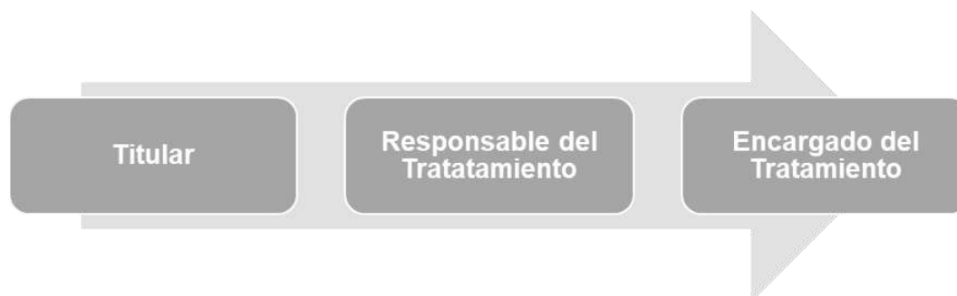
Figura 2. Conceptos básicos. Actores: titular, responsable y encargado

Titular: persona natural a la que pertenecen los datos personales.