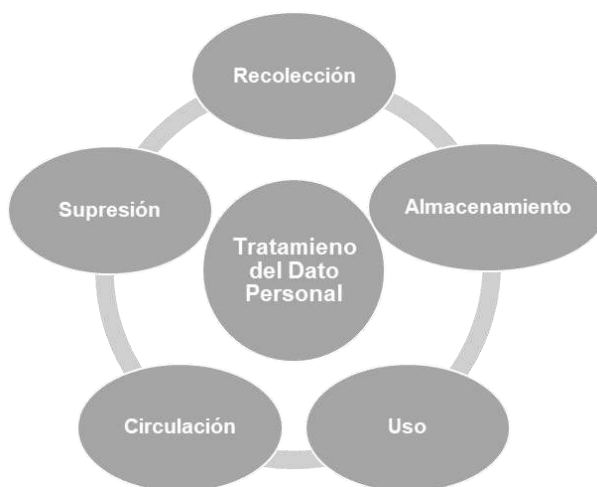
Figura 3. Conceptos básicos. Tratamiento del dato personal

Encargado del tratamiento de datos personales: persona natural o jurídica, pública o privada, que por sí misma o en asocio con otros, realice el tratamiento de datos personales por cuenta del responsable del tratamiento (por ejemplo: los proveedores, los clientes, entre otros)