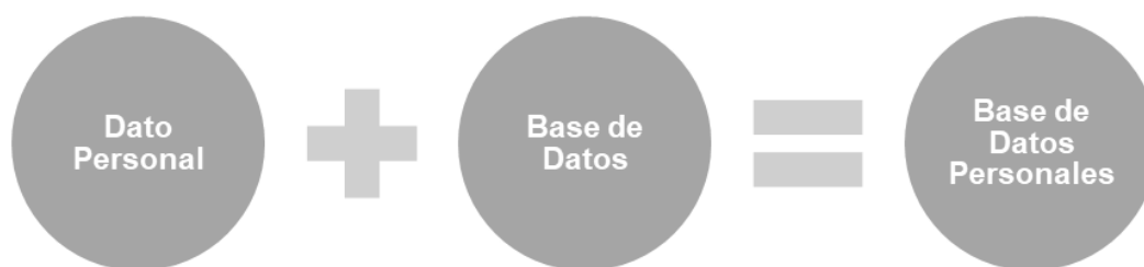
Figura 1. Conceptos Básicos. Dato personal

No obstante, con la finalidad de facilitar el entendimiento de estos lineamientos, se detallan los siguientes conceptos: